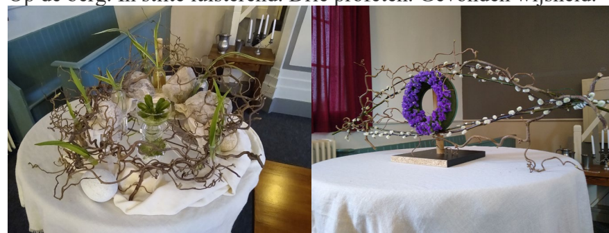
Foto 3: Jezus zei tegen haar: Ik ben het, degene die met u spreekt. Johannes 4: 26

Bronnen van inspiratie. Spiegels met gedachten. Verbinding voor mij en jou.