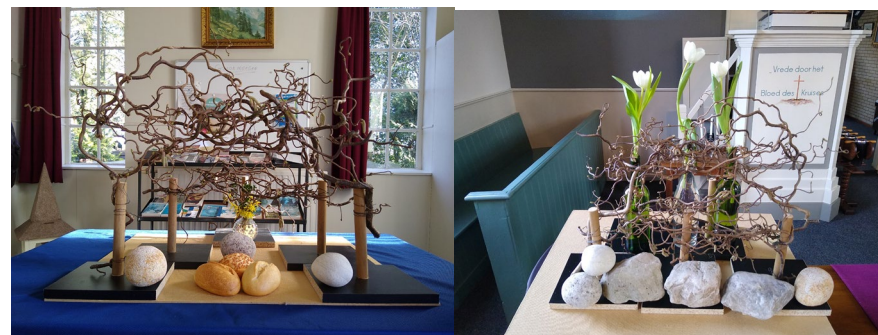
Foto 1: Want er staat geschreven: Aanbid de Heer uw God, vereer alleen Hem. Matteüs 4:10b Uit liefde voor jou. Wandelen in de woestijn. Leeftocht. Het vergezicht.